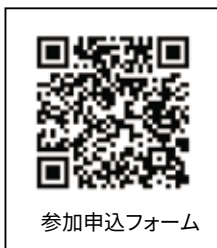
参加申込フォーム