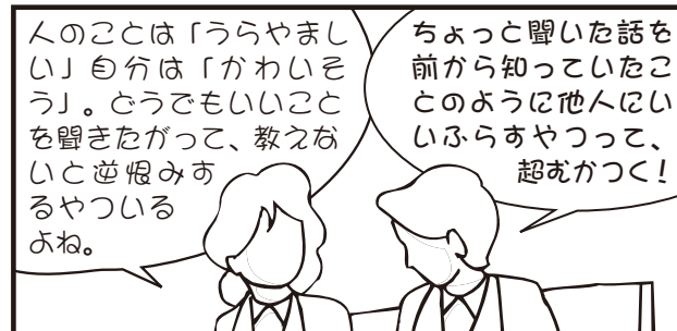
枕草子『にくきもの』より ※実際の活動で使う古典の題材は違う場合もあります。